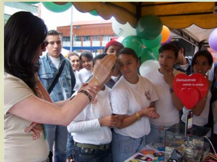
Salud sexual y reproductiva.