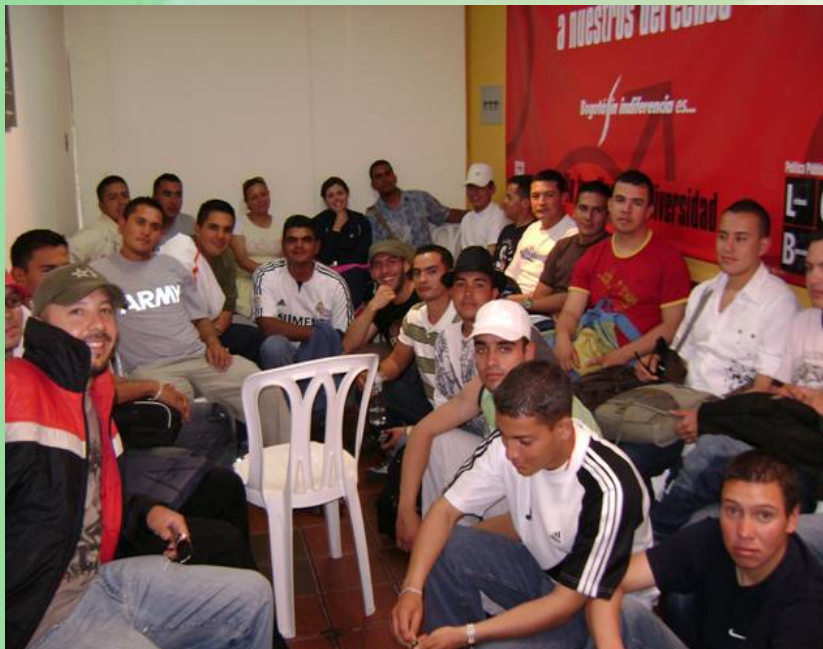
Talleres de sensibilización (Policía)